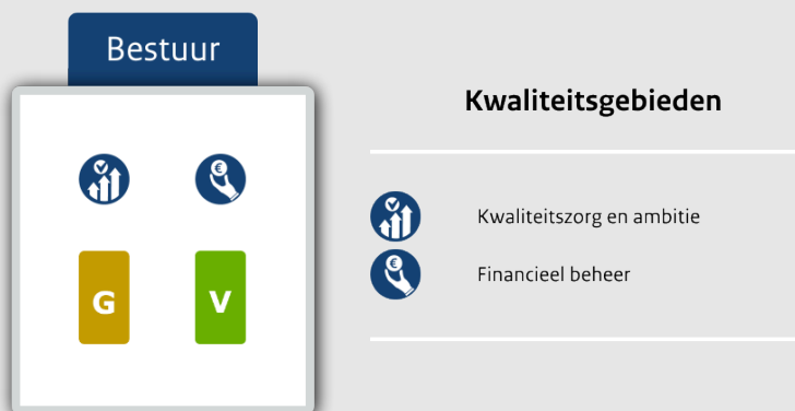
Oordelen op bestuursniveau voor de gebieden Kwaliteitszorg en ambitie en Financieel beheer

In onderstaande figuur zijn de resultaten samengevat. Te zien is wat de oordelen zijn op de twee onderzochte kwaliteitsgebieden op bestuursniveau. Ook is weergegeven in hoeverre onze oordelen overeenkomen met het beeld dat het bestuur zelf heeft van de gerealiseerde kwaliteit op de scholen en in hoeverre het beleid van het bestuur doorwerkt tot op schoolniveau.